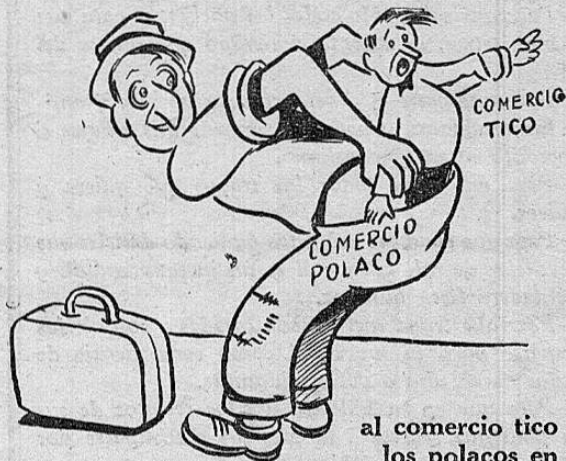
al comercio tico se lo echan los polacos en el bolsillo

todos los tiempos, pero ya está cansado de la fiesta y por nada del mundo acepta una reelección. Y en estas circunstancias nuestro viejo amigo que es más bueno que el pan y que con nadie se enoja, perdió los estribos cuando ayer tarde le fueron a proponer una reelección. Gabú oyó al proponente, pero cuando éste le dijo que si quería aceptar una diputación, no pudo más y le empujó tamaño cato. (Así como suena!